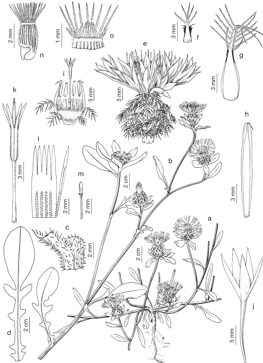
Figura 3. Centaurea involocrata , a-o) La Mojonera, Almería (COFC 54274): a) hábito; b) porción de tallo florido; c) detalle de nudo del tallo e indumento; d) hoja caulinar; e) capitulo; f) bráctea externa del involucre; g) bráctea media del involucre; h) bráctea interna del involucre; i) sección de un capitulo neutro; k) corola de una flor hermafrodita y verticilos sexuales; l) limbo de la corola de una flor hermafrodita seccionada mostrando los filamentos estaminales y un estambre completo; m) parte superior del estilo y ramas estilares; n) aquenio con vilano; o) detalle parcial del vilano externo, y vilano interno. Dibujos por R. Tavera (Sevilla).